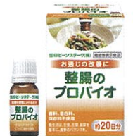
整腸のプロバイオ

お申し込みの際の注意事項がございますので、申込フォームをご参照の上、ご登録ください。