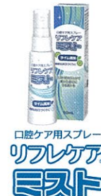
口腔ケア用スプレー リフレケア ミスト