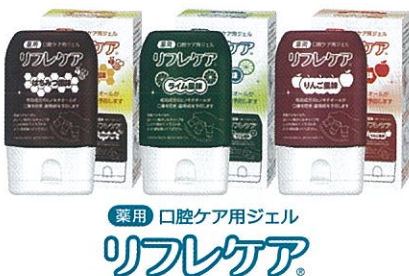
薬用 口腔ケア用ジェル リフレケア