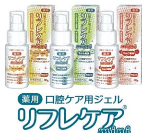
薬用 口腔ケア用ジェル リフレケア