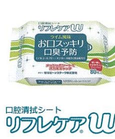
口腔清拭シート リフレケアW