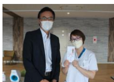
資格チャレンジ 応援金

資格チャレンジ応援金/資格活用特別手当 マラソン大会応援金/登山応援金 サンクスカード制度/ベストスマイル賞 職員医療費補助制度/研修費補助制度