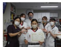
ベストスマイル賞