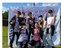
マラソン大会 応援金